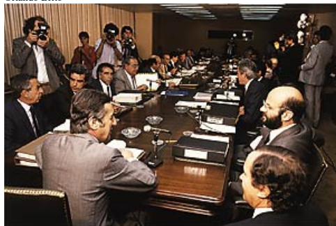
TRÊS SÉCULOS DE DEFASAGEM Reunião do Conselho Monetário Nacional no governo Sarney: até os anos 80, o governo fazia o que queria na economia

Para se ter uma idéia do tamanho do atraso que tais práticas significavam, basta lembrar que os ingleses fizeram em 1688 as mudanças que ficaram conhecidas como Revolução Gloriosa e significaram, em resumo, a perda do poder absoluto do rei de criar dívidas e impostos, atribuição que foi transferida ao